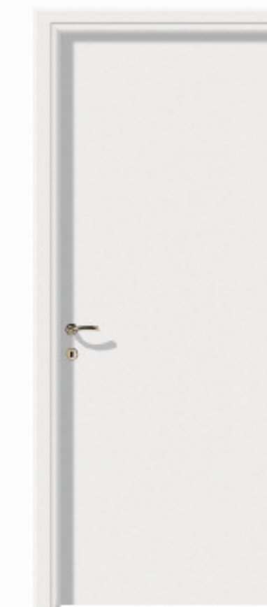
ORMINA / PORTA LISCIA